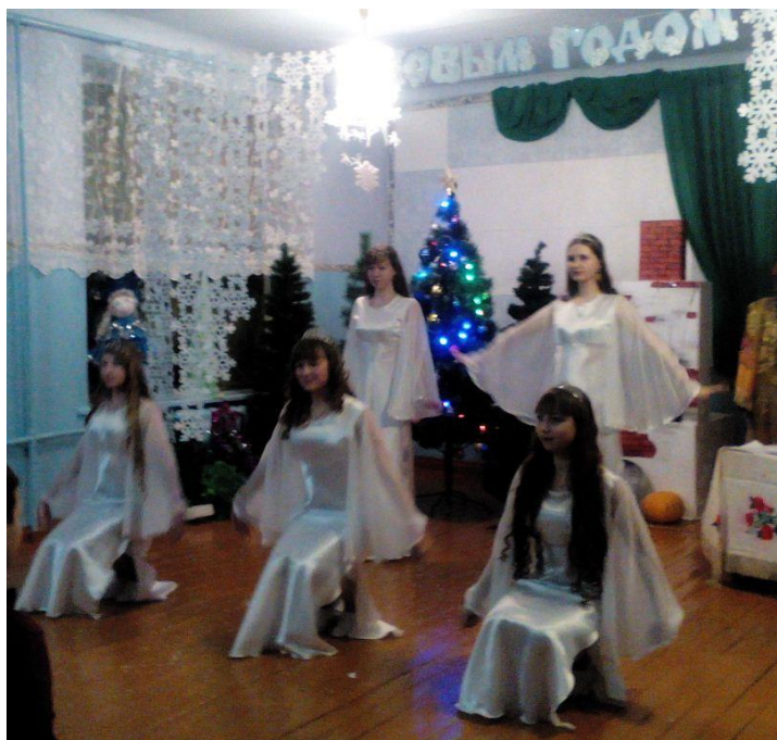
Танцевальный коллектив (вверху). Празднование Масленицы (театральная мастерская)