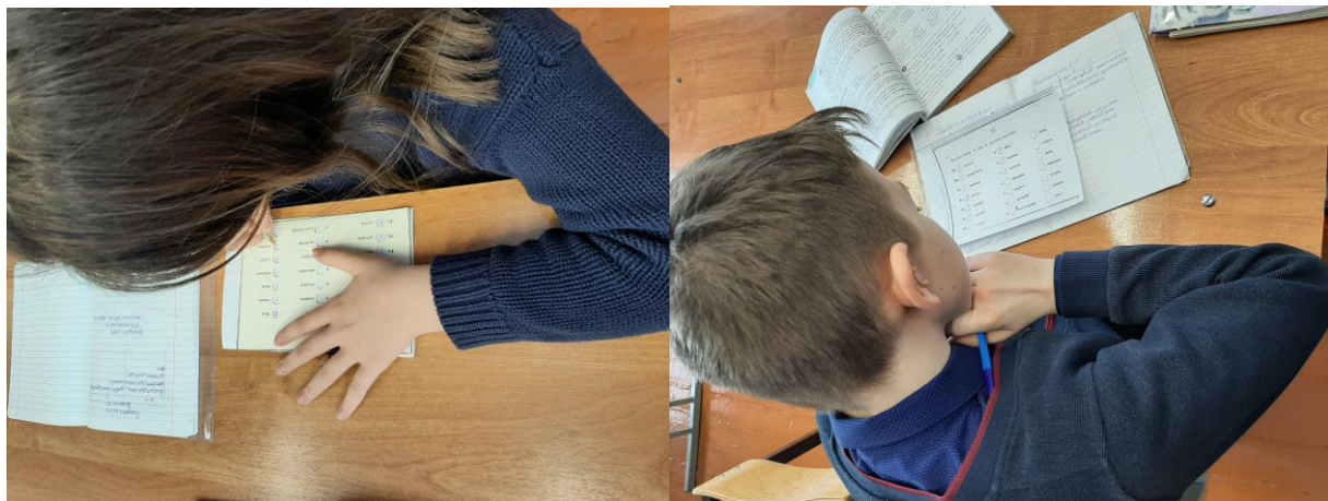
Участники школьной олимпиады по русскому языку.