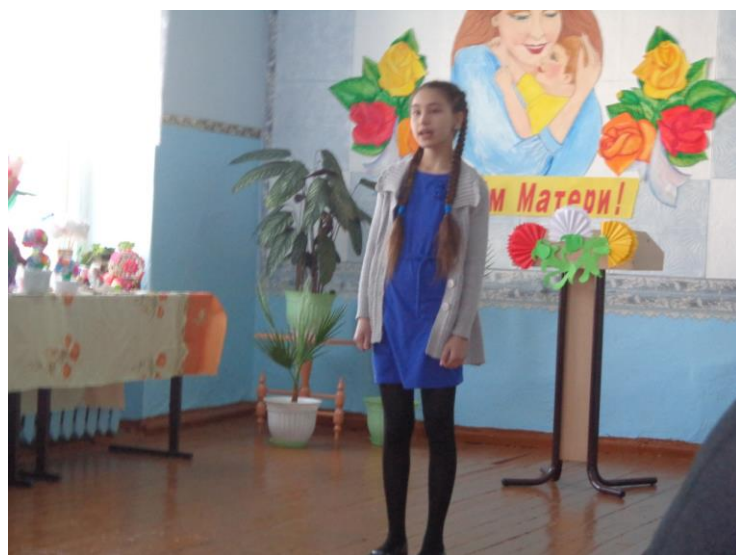
Победитель конкурса чтецов ко Дню матери