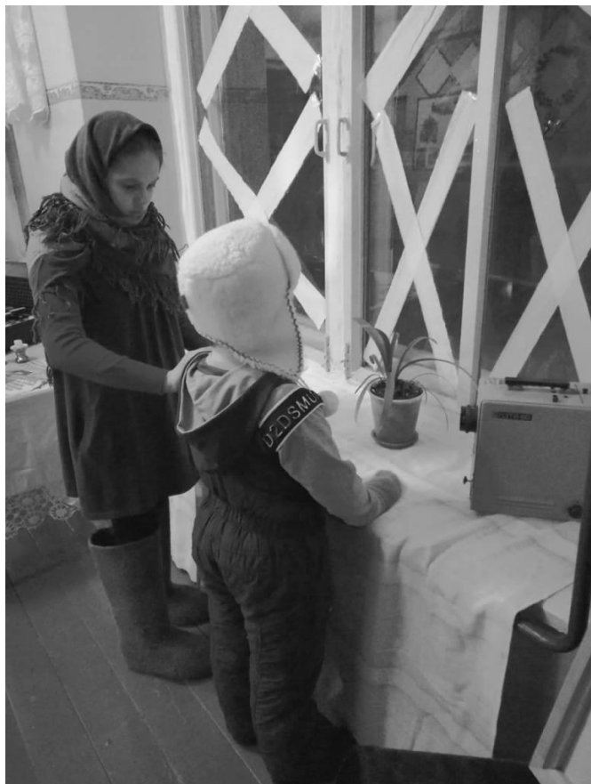
Импровизация «Блокадный ленинград»