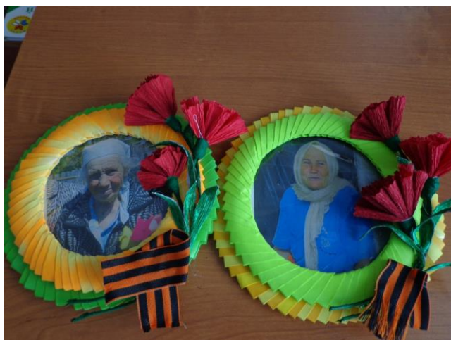
Подарки своими руками для ветеранов.