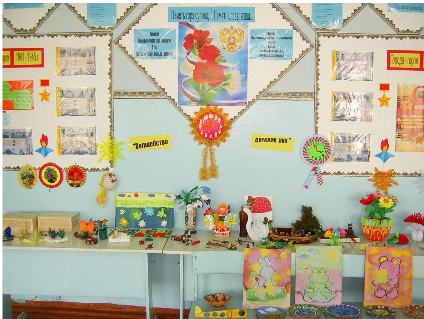
Выставка «Волшебство из детских рук»