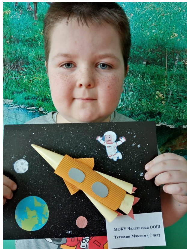
Исследовательские работы «Ордена и медали» (3 класс), «Покорение космоса» (1 класс)